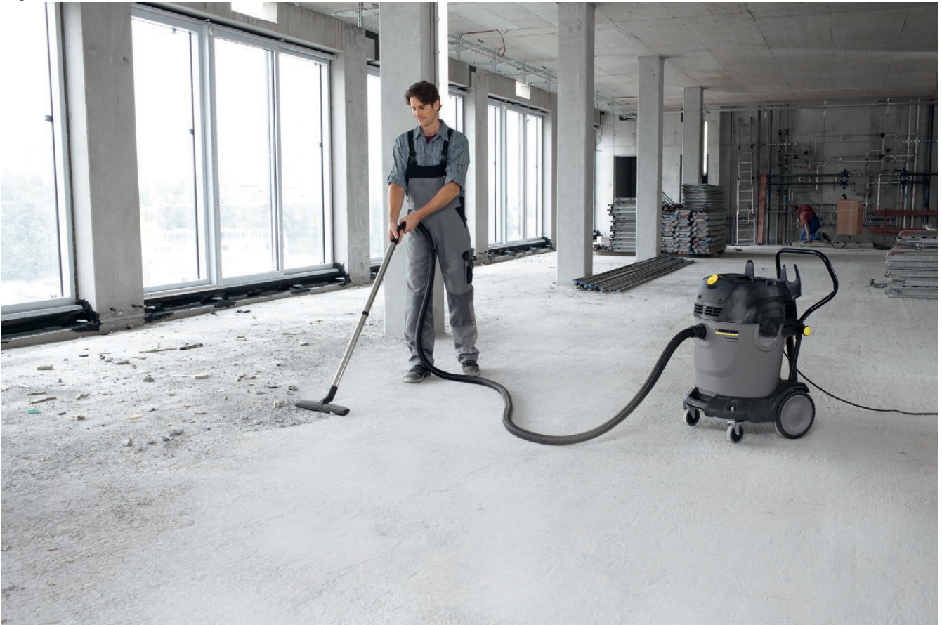
NT 65/2 Tact² Tc